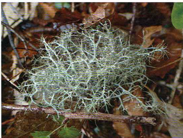
▲バンダイキノリ。食用にする地域もあります。