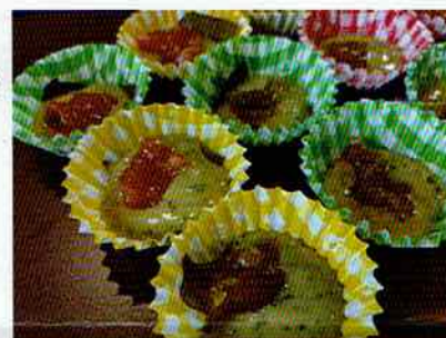
これを10分蒸せば完成

メナモミの苦みも消え、ジャムの酸味と甘みのバランスがたまりません。ふかふかで、とても食べやすい夏らしいまんじゅうでした。