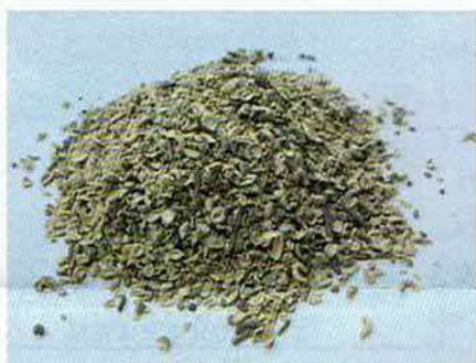
▲サンショウの果皮