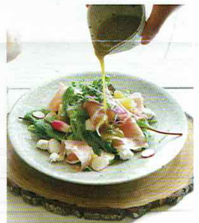
▲イタドリジャムをドレッシングにアレンジ